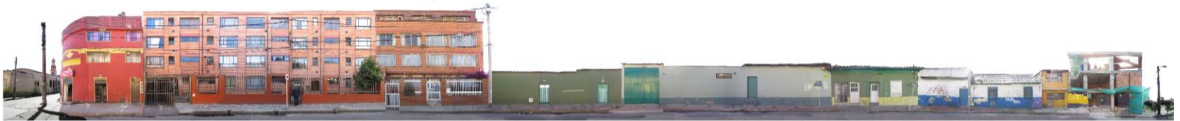
CARRERA 3 BIS