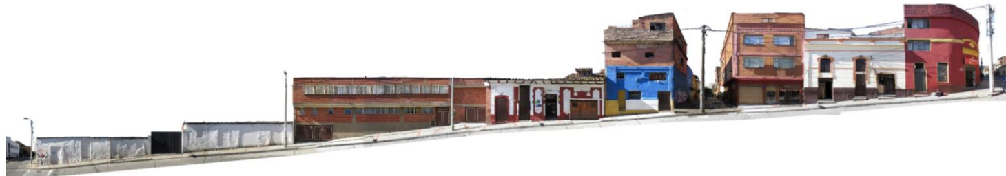
CALLE 6A BIS