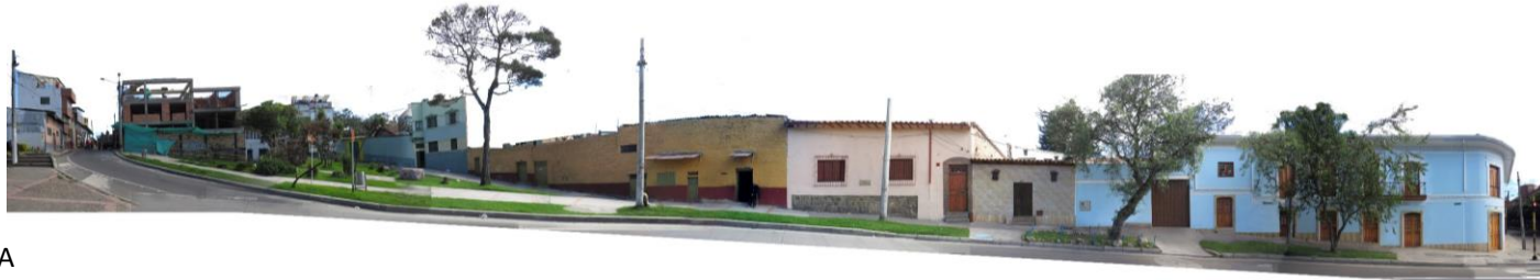
CALLE 6A BIS A